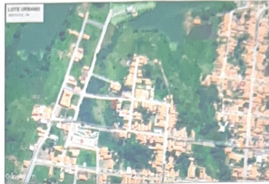
IMAGEM GOOGLE EARTH